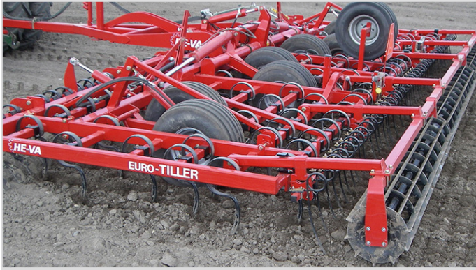
8,00 m Euro-Tiller mit Spring-Board, Flacheisenwalze einschl. Striegel und Ersatzrad.