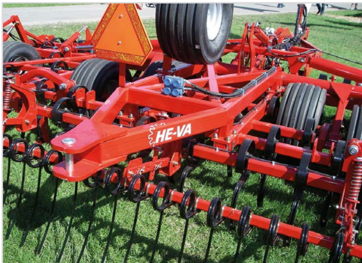
Euro-Tiller mit Zugmaul hinten für z.B. Solowalze.