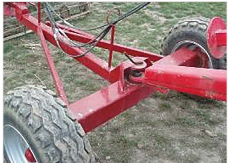
Dolly: Radsatz, der eine Ankupplung von Walzen hinter der Egge ermöglicht – 11.5/80 x 15.3 Rad.