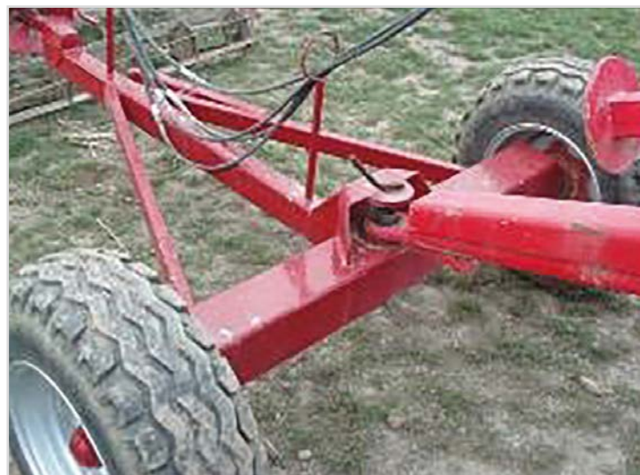
Dolly: Chariot avec roues permettant d'atteler un rouleau derrière le vibroculteur. Roues 11,5/80 x 15,3.