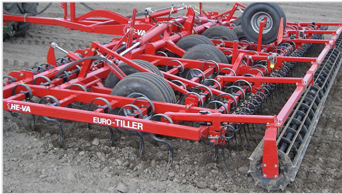
Euro-Tiller 8,00 m avec lame niveleuse Spring-Board, rouleau à barres plates, herse peigne arrière et roue de secours.