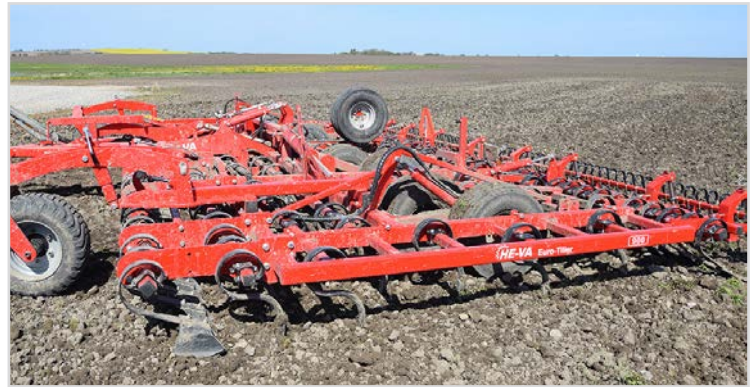
Euro-Tiller 9,00 m avec dents 65x12 mm, rangée supplémentaire 65x12 mm, Spring-Board avant et arrière, herse peigne arrière et roues supports à l'avant.