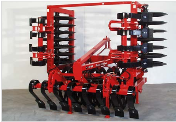
4,00 m Ø800 mm repliage hydr. et Spring-Board.