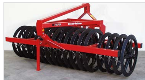
3,00 m Ø800/900/800 mm