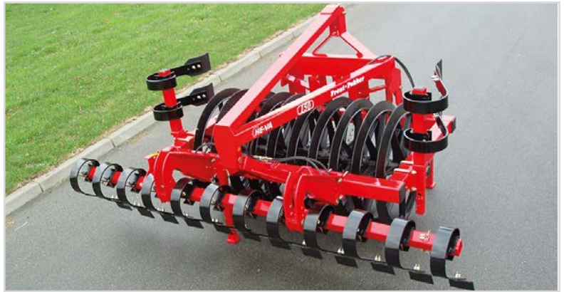
1,50 m avec 4,00 m Spring-Board en position transport