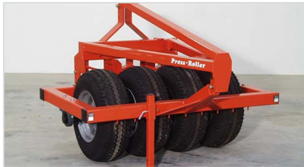
Press-Roller H760 1,50 m.