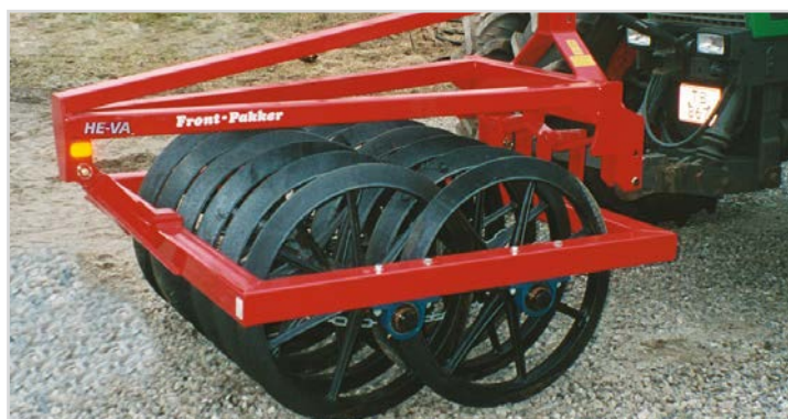
Front-Pakker Twin 1,50 m av/anneaux Ø800

*Requiert une prise d'huile double effet