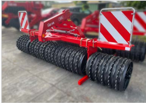
Front-Roller mit stabile Selbstlenkung durch den weit vorne liegenden Zugpunkt. Mit Lehnbock