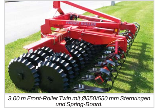
3,00 m Front-Roller Twin mit Ø550/550 mm Sternringen und Spring-Board.