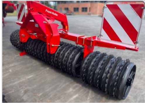
Front-Roller mit stabile Selbstlenkung durch den weit vorne liegenden Zugpunkt. Mit Lehnbock