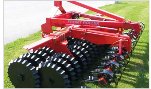
3,00 m Front-Roller Twin med Ø550/550 mm Stjerneringe og Spring-Board