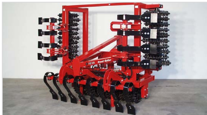
3-leds 4,00 m Front-Roller med Crossskill, hydraulisk opklap og Spring-Board