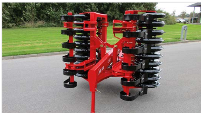
2-leds 3,00 m Front-Roller med V-Profil, hydraulisk opklap og Spring-Board