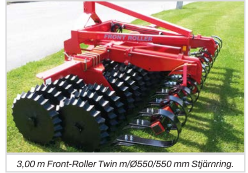
3,00 m Front-Roller Twin m/Ø550/550 mm Stjärnring.