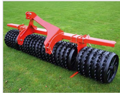
Front-Roller med ett fast trepunktsfäste - inte självstyrande