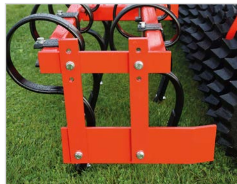
Kantutrustnings sats till främre pinnrad