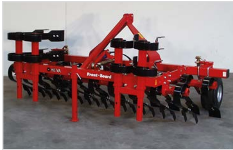
4,00 m Front-Board mit Krustenbrecherscharen.