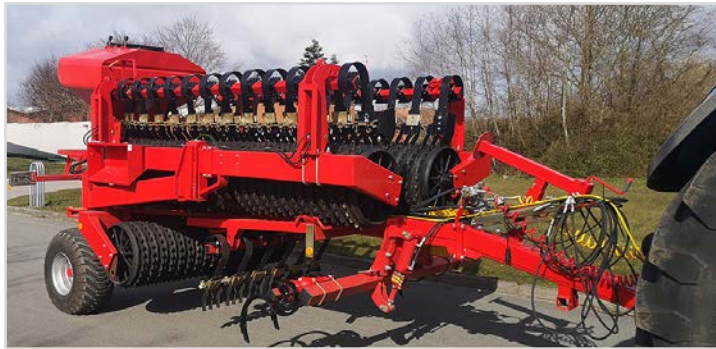
Ihopfäld Tip-Roller med Multi-Seeder, Spring-Board samt spårluckrare