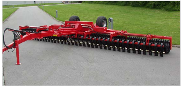
10,20 m m/620 mm/24", m/Spring-Board och Tvärlåssystem.