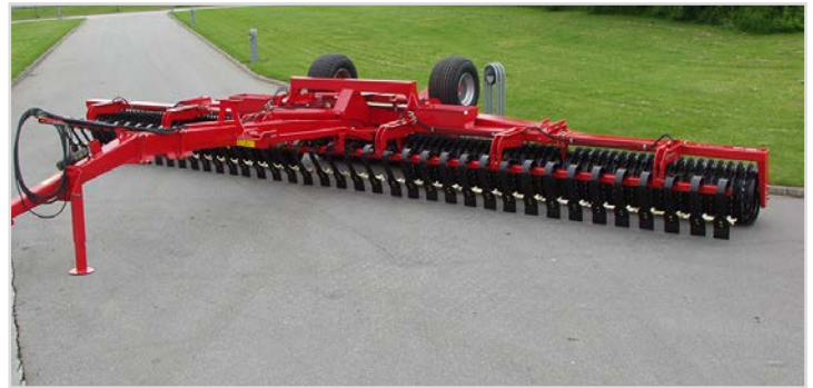
10,20 m. Tip-Roller mit 620 mm/24" Cambridge, Spring-Board und Querverriegelung.