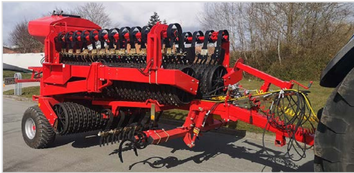
Tip-Roller mit Multi-Seeder, Spring-Board und hydr. Spurlockerer