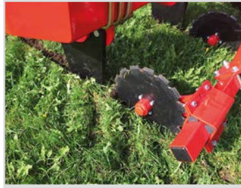
Ø400 mm gezackte Schneidscheiben