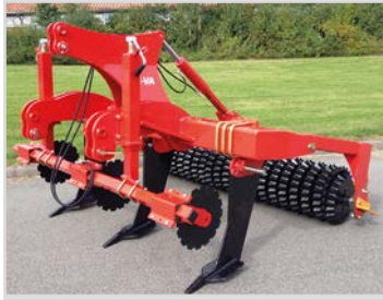
2,50m m/Quick-Push und Sternwalze