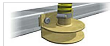
Breite Aussaat per Prallteller vor Packerwalze

Nur eine Spezialwalze für Raps/Dünger ist im Preis enthalten. Bitte wählen Sie aus einer der folgenden Saat-Methoden sowie ein Multi-Seeder Modell