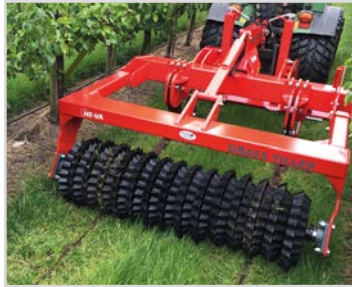
1,80 m Grass-Tiller med Quick-Push og stjernevalse