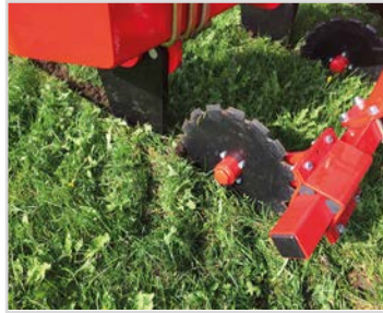
Ø400 mm rulleskær