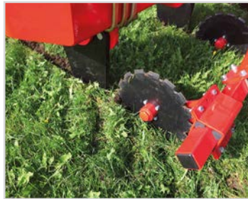
Disques crénelés Ø400 mm devant chaque dent.