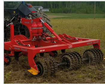
2,50 m avec sécurité autom. hydr. et rouleau étoile synchronisé.