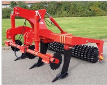
2,50 m avec Quick-Push et rouleau étoile.