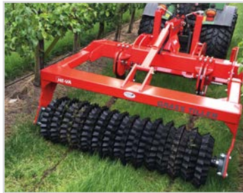
1,80 m avec Quick-Push et rouleau étoile.