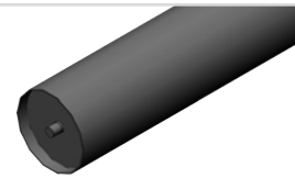
Rouleau lisse Ø406 mm