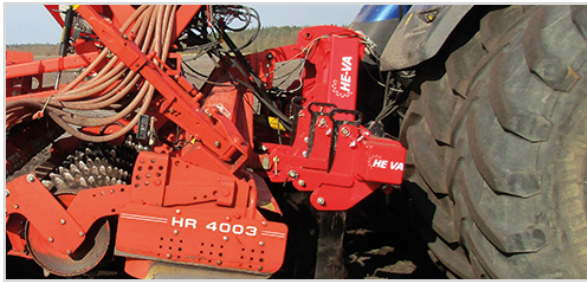
4,00 m Combi-Tiller PTO med 5 tænder