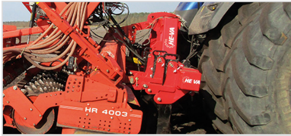
4,0 m Combi-Tiller PTO avec 5 dents.