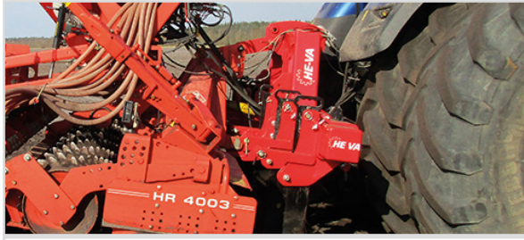
4,00 m Combi-Tiller PTO mit 6 Zinken