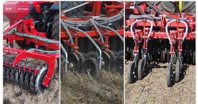
Semis en bande à l'avant du rouleau packer

Les modèles avec Semis à disques sont montés avec un disque double, à suspension par parallélogramme. La paire comprend un disque de diamètre Ø350mm et d'épaisseur 3 mm, avec un rouleau presseur de diamètre Ø330mm et une épaisseur au choix de 75 mm ou 50 mm.