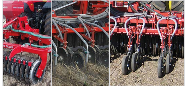
Band-Aussaat vor der Packerwalze

Die Säeinheiten sind mit Doppelscheiben ausgerüstet und werden im Parallelogramm geführt (Sädscheiben Ø 350 mm, Stärke 3 mm; Druckrolle Ø 330 mm, Breite 50 bzw. 70 mm).