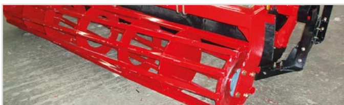
Ø550 mm Schwere Rohrstabwalze

*2 Stck. doppeltwirkende Hydraulikanschlüsse und 1 Stck. einfachwirkender Hydraulikanschluß erforderlich.