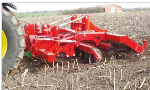
Combi-Disc mit den Zinken in max. Arbeitstiefe, gewährleistet Tiefenlockern, Kultivierung und Rückverfestigung.