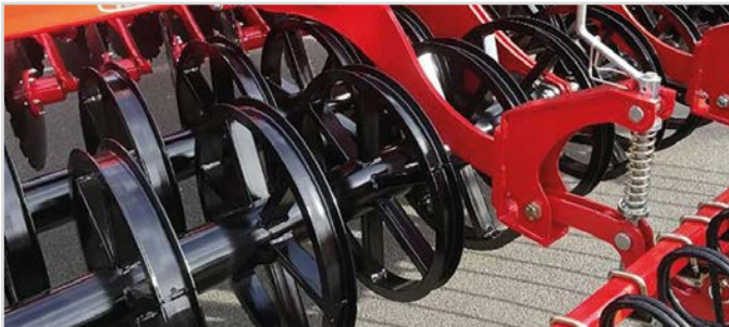
Ø600 mm U-Profilwalze Twin

1* 3 Stck. doppeltwirkende Hydraulikanschlüsse und 1 Stck. einfachwirkender Hydraulikanschluß erforderlich.