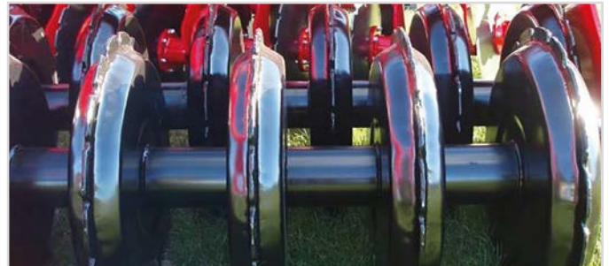
Ø600 mm V-Profilwalze Twin