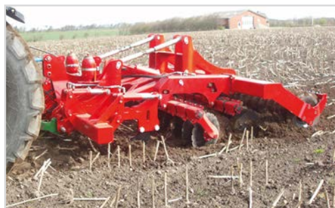
Combi-Disc med tænderne i fuld arbejdsdybde. Dermed opnås grubning, kultivering og pakning.