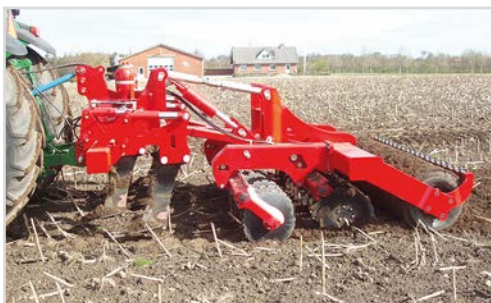
Combi-Disc med grubbertænderne løftet fri af jorden, og dermed er kun Disc-Roller funktionen i arbejde.