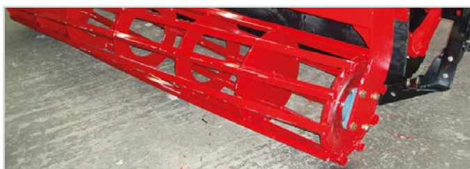
Ø550 mm Svær Rørvalse

1 Kræver 2 stk dobbeltvirkende olieudtag og 1 stk. enkeltvirkende olieudtag.