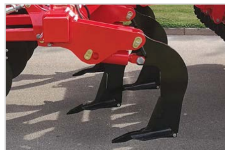
Tanddesign på Combi-Disc og Combi-Tiller MKII