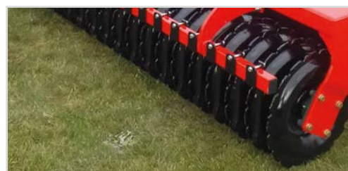
Ø600 mm V-Profilvalse