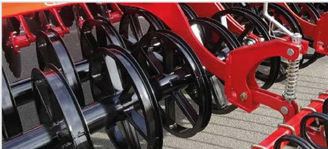
Ø600 mm U-Profilvalse Twin

*1 Kræver 3 stk dobbeltvirkende olieudtag og 1 stk. enkeltvirkende olieudtag.