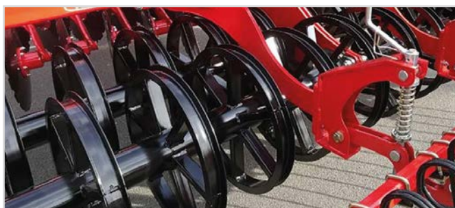
Ø600 mm U-Profilvals Twin

*Kräver 3 st. dubbelverkande oljeuttag och 1 st. enkelverkande oljeuttag.