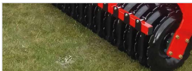
Ø600 mm V-Profilvals