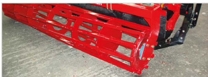
Ø550 mm Rörvals med fyrkantör

1 Kräver 2 st dubbelverkande oljeuttag och 1 st. enkelverkande oljeuttag.