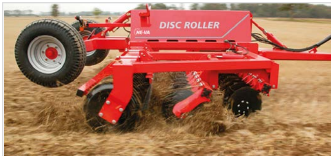
5,00 m m/V-Profilvals och materialdämpare.