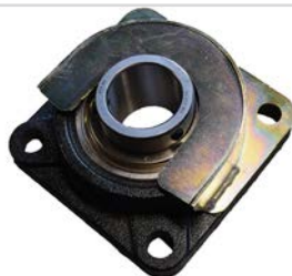
Logement de protection pour roulement