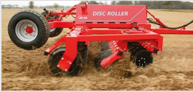
5,00 m mit V-Profilringen und Spritztuch für das Material