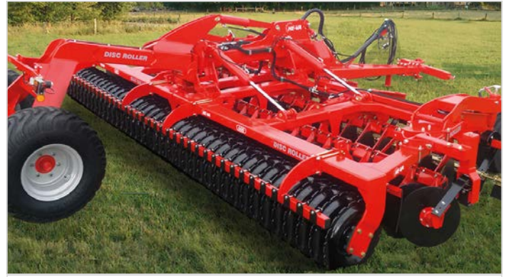
6,50 m Disc-Roller m/V-Profilvalse, materialedæmperskærm, drejbart støtte-/dybdehjul og svingbart træk