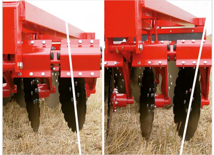
Standardudstyr på alle modeller: "DSD": Dybde Synkron Disc-aggressivitet.