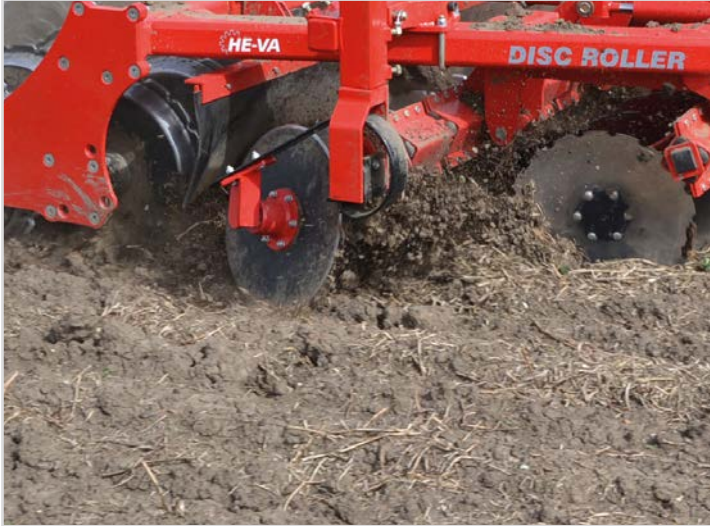
Standardudstyr på alle modeller: Justerbar kanttallerken for jævn overgang mellem hvert træk, højre side.