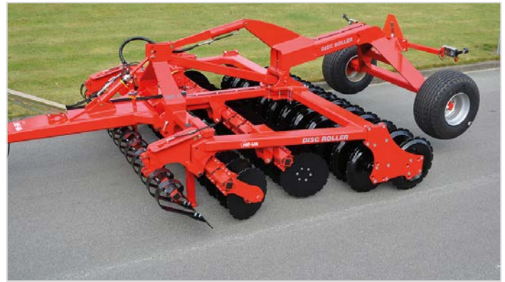
3,50 m Disc-Roller Contour bugseret m/Twin V-Profilvalse og Spring-Board.