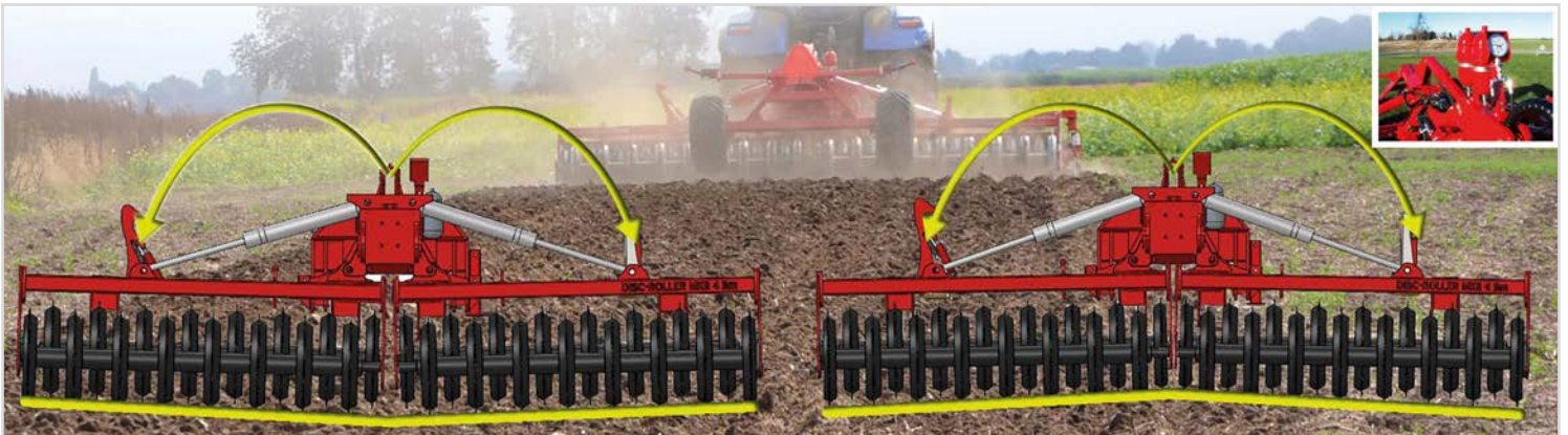
Standardudstyr på 2- og 3-leds modeller: HE-VA SAT-System: Hydraulisk justerbar vægtoverføringssystem, der sikrer ens vægtoverføring i hele arbejdsbredden og samtidig bevirker at vingesektionerne følger terrænet.