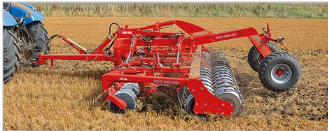
5,50 m Disc-Roller Contour med Twin V-Profilvalse og materialedæmperskærm.