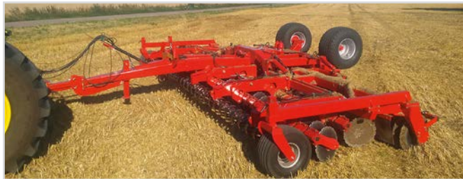
8,00 m Disc-Roller Contour med V-Profilvalse, drejbare støtte/dybdehjul.