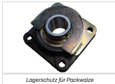
Lagerschutz für Packwalze