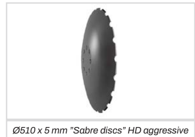
Ø510 x 5 mm "Sabre discs" HD aggressive