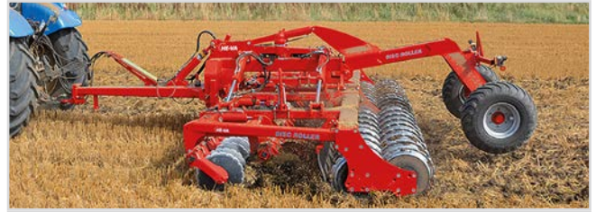
5,50 m mit Twin V-Profilwalze und Spritztuch für das Material