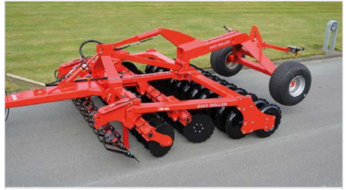
3,50 m Disc-Roller Contour aufgesattelt m/Twin V-Profilwalze und Spring-Board