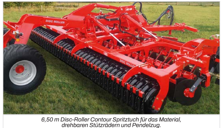
6,50 m Disc-Roller Contour Spritz Tuch für das Material, drehbaren Stützrädern und Pendelzug.