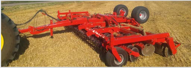
8,00 m mit V-Profilwalze und lenkbaren Stützrädern