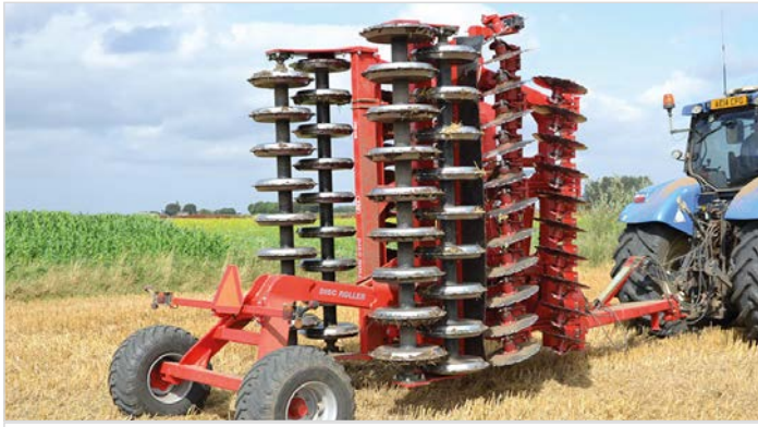
5,50 m Disc-Roller Contour mit Twin V-Profilwalze und Spritz Tuch für das Material.