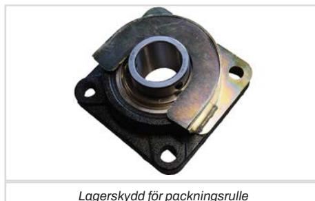
Lagerskydd för packningsrulle