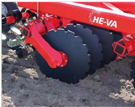
Disque standard Ø610x6mm – à profil de coupe fine