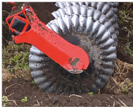
Disque Ø570x6 mm "Sabre-disc" d'incorporation des résidus