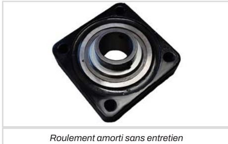
Roulement amorti sans entretien