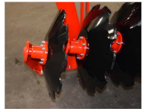
Disque Ø610x6mm à profil de coupe grossière