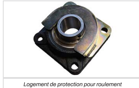
Logement de protection pour roulement