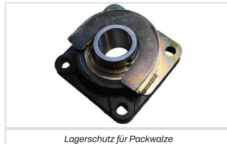
Lagerschutz für Packwalze