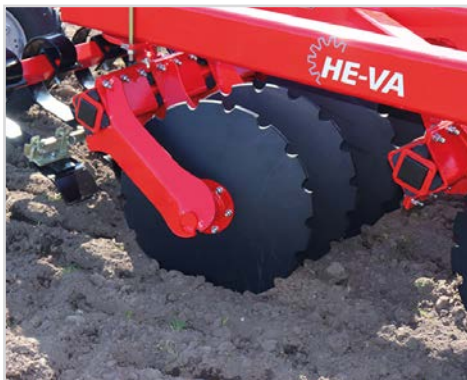
Scheibe Ø610x6 mm Standard feine Zahnung