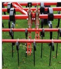
Réglage séparé de profondeur