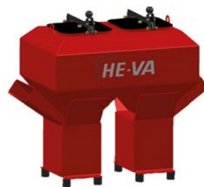
Multi-Seeder Twin 90/140-12-HY-AC 668 x 800 (1.180) mm H=900 (1.076) mm