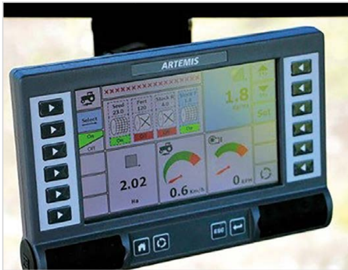
HE-VA dator till Multi-Seeder Twin vid montering av 2-3 sålådor