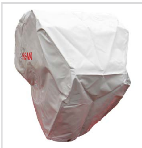
Presenning för Multi-Seeder

1* Vid val av annan drivkabel längd än standard 1,8 m, korrigeras priset i förhållande till standard.