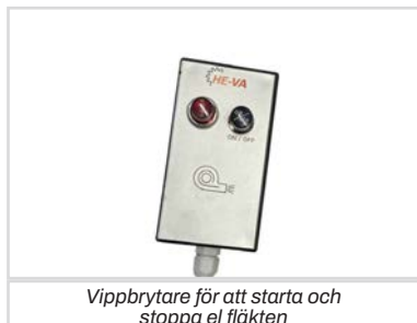
Vippbrytare för att starta och stoppa el fläkten