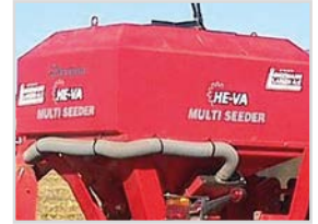
1150-8-HY-FZ-AC 1.014x1.640 mm H= 1.530 mm