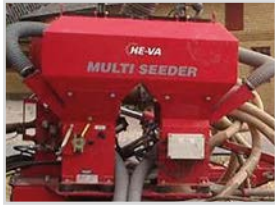
Twin 2 x 100 593x926(1.180)mm H=935 (1.075) mm