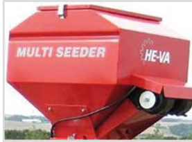
200-8-EL 650x650(770)mm H=980 mm