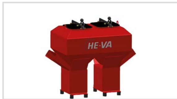
Multi-Seeder Twin 90/140-12-HY-AC 668 x 800 (1.180) mm H=900 (1.076) mm