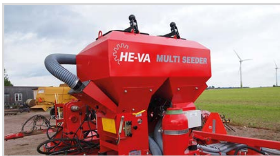
Multi-Seeder Twin 2x100-8-HY-AC 593 x 926 (1.180) mm H=935 (1.075) mm