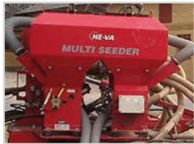
Twin 2 x 100 593x926(1.180)mm H=935 (1.075) mm