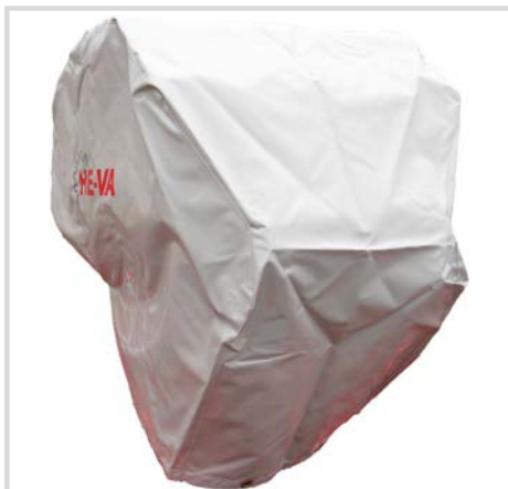
Bâche pour semoir Multi-Seeder

1 Longueur câble d'entraînement = 1,8 m. Autres longueurs disponibles à la demande.