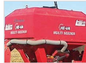
1150-8-HY-FZ-AC 1.014x1.640 mm H= 1.530 mm