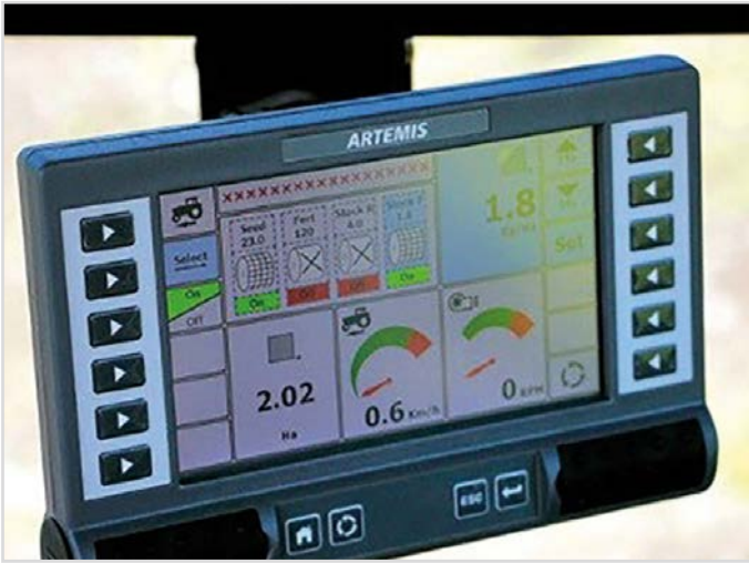
HE-VA Terminal: Pour contrôle Multi-Seeder Twin et sur machines avec 2 à 3 trémies de semences.