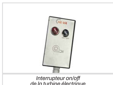
Interrupteur on/off de la turbine électrique