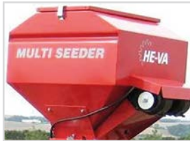
200-8-EL 650x650(770)mm H=980 mm