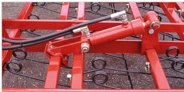
Hydr. inställning av pinnaggressivitet