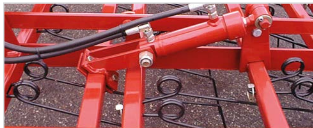
Hydraulisch verstellbarer Zinkendruck