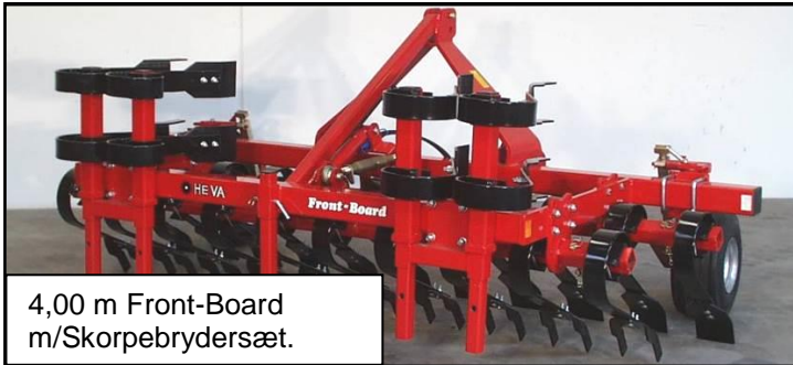
4,00 m Front-Board m/Skorpebrydersæt.