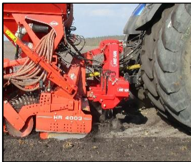
4,0 m Combi-Tiller PTO med 5 tænder.

Justerbar højde på de bagerste koblingspunkter.