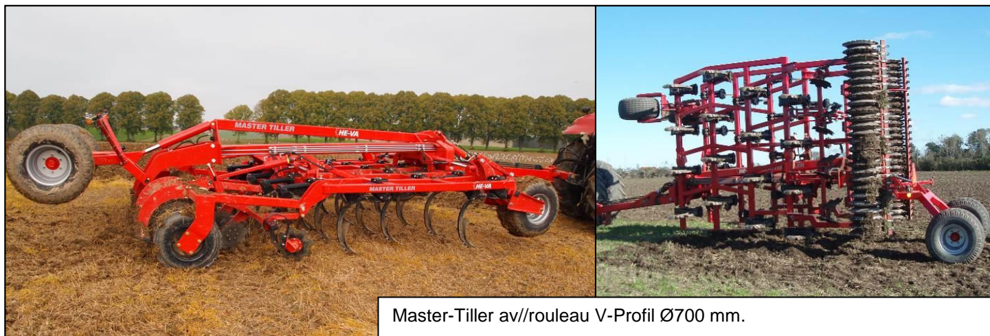
Master-Tiller av//rouleau V-Profil Ø700 mm.