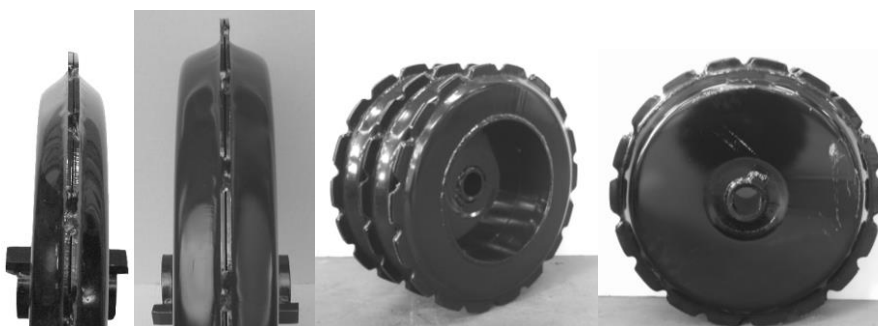
600 mm 700 mm

Diam.: 600 & 700 mm Lukket stårling fremstillet af 4/5 mm op-presst plade og sammensvejt, hvilket resulterer i en høj styrke. Med denne styrke er ringen effektiv i meget stenede jordtyper. Den takkede ring sikrer en effektiv knusning og ideel sammenpakning af ny pløjet jord før såning. Ringen bliver også anvendt i forbindelse med reduceret jordbearbejdning og stubbearbejdning.