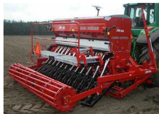
3,00 m Combi-Seeder VB