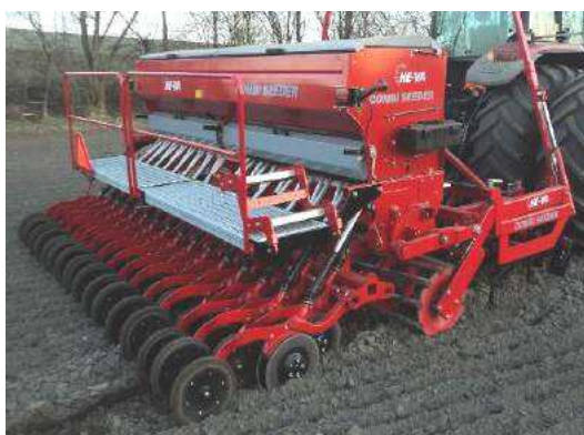
4,00 m Combi-Seeder VF m/skiveskær