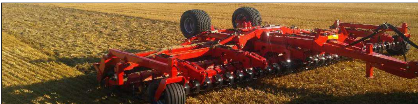
8,00 m Disc-Roller Contour m/V-Profilvalse, materiale-dæmpeskærm, Spring-Board og drejbare støtte/dybdehjul.