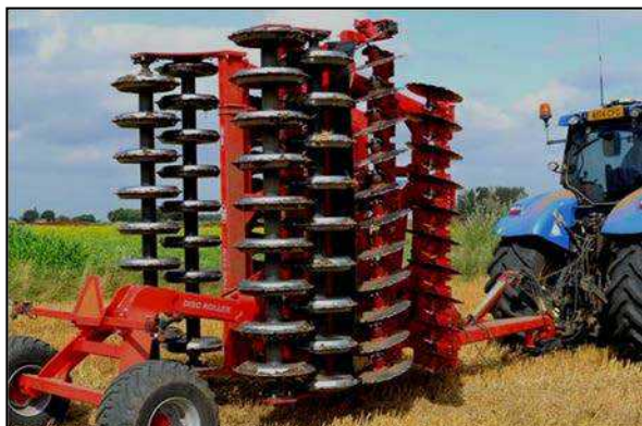
5,50 m Disc-Roller Contour m/Twin V-Profilvalse og materiale-dæmpeskærm.