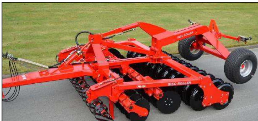
3,50 m Disc-Roller Contour bugseret m/Twin V-Profilvalse og Spring-Board.