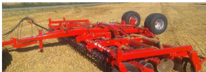
8,00 m Disc-Roller Contour med V-Profilvalse, drejbare støtte/dybdehjul.