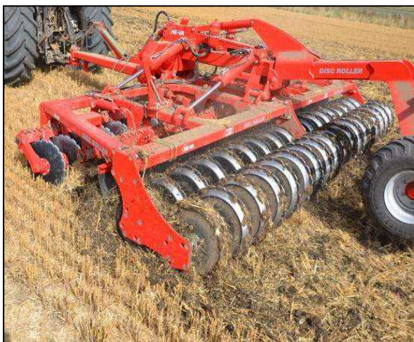
6,50 m Disc-Roller m/V-Profilvalse, materialedæmpeskærm, drejbart støtte-/dybdehjul og svingbart træk