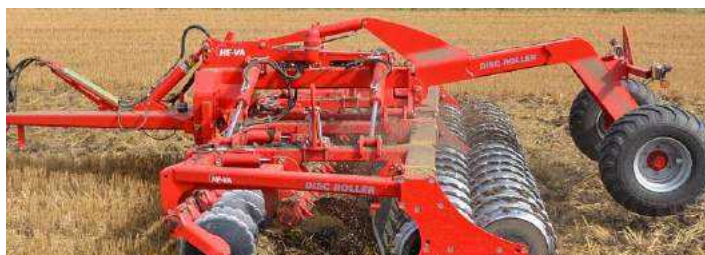
5,50 m Disc-Roller Contour m/Twin V-Profilvalse og materiale-dæmpeskærm.