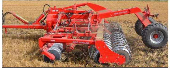
5,50 m m/Twin V-Profilwalze & Spritztuch f/das Material.