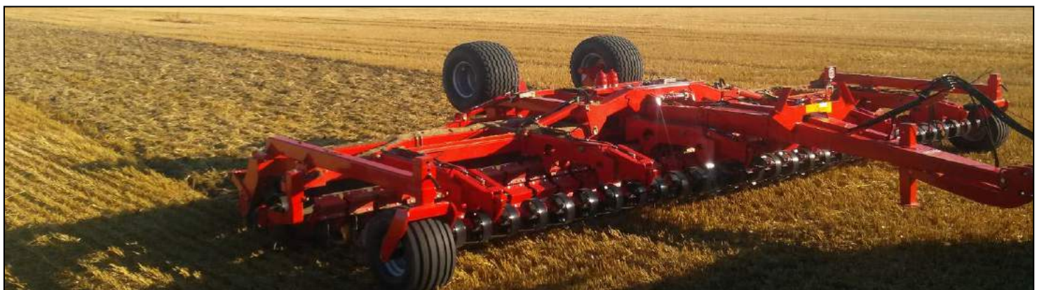
6,50 m Disc-Roller Contour m/V-Profilwalze, Spritztuch für das Material, lenkbaren Stützrädern.