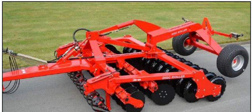
3,50 m Disc-Roller Contour aufgesetzt m/Twin V-Profilwalze und Spring-Board