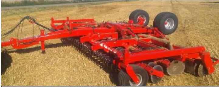
8,00 m m/V-Profilwalze und lenkbaren Stützrädern