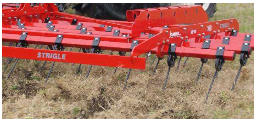
6,00 m Top-Strigle m/5 buller og 16 mm tænder