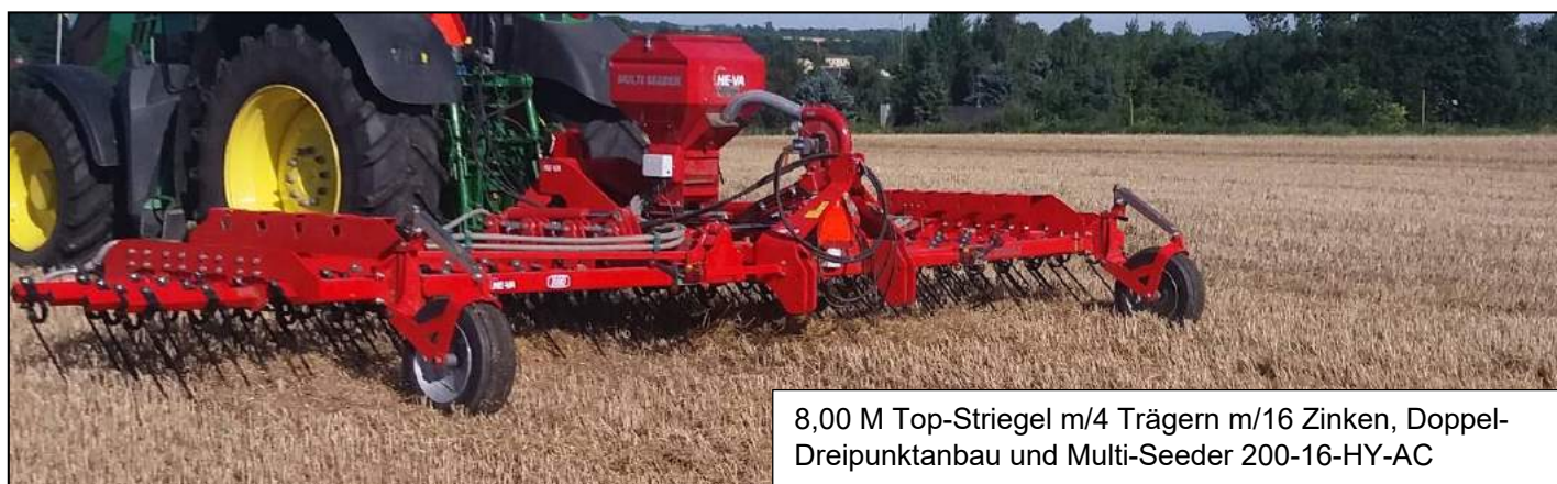
8,00 M Top-Striegel m/4 Trägern m/16 Zinken, Doppel-Dreipunktanbau und Multi-Seeder 200-16-HY-AC