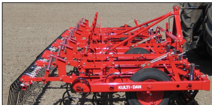
6,40 m Kulti-Dan m/planerplanke & langfinger-efterharve