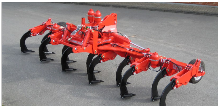
6,00 m Combi-Tiller MKII med 11 pinnar.