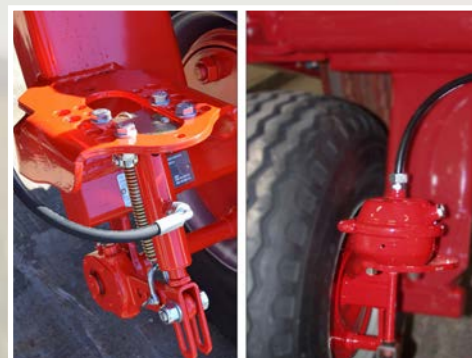
La frenatura idraulica / ad aria