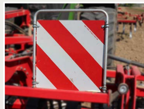
Tabelle di ingombro smontabili per una guida in sicurezza.