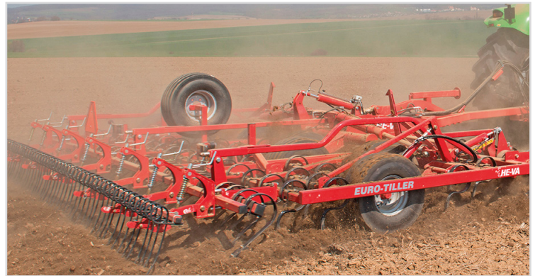
Euro-Tiller 6,00 m avec rangée de dents efface traces, Spring-Board frontale à lames de ressort, Spring-Board arrière, herse peigne arrière et roue de secours.