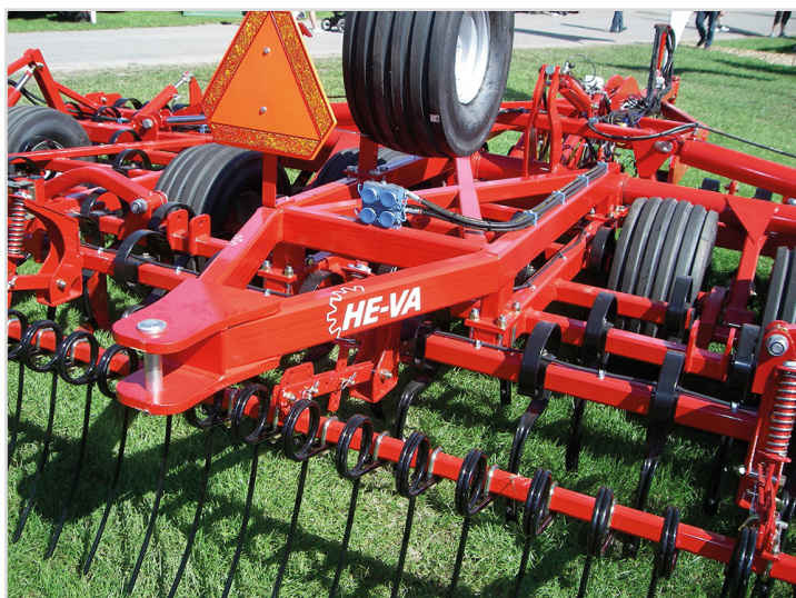
Euro-Tiller avec l'attelage dirigée vers l'arrière