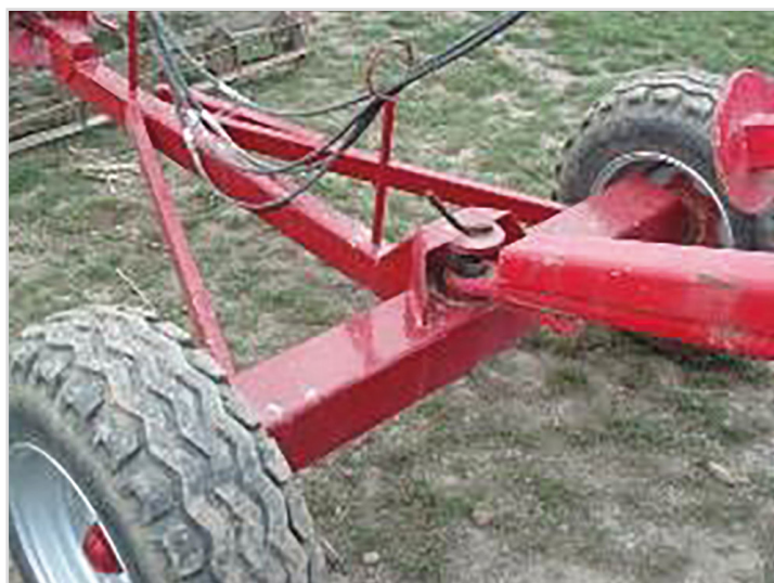
Dolly: Chariot avec roues permettant d'atteler un rouleau derrière le vibroculteur. Roues 11,5/80 x 15,3.