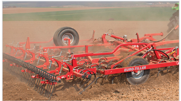
6,00 m Euro-Tiller m/svær forharve, Spring-Board planerplanke, Spring-Board efterharve, langfinger-efterharve og reservehjul