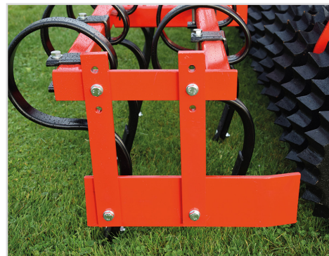
Kantutrustnings sats till främre pinnrad