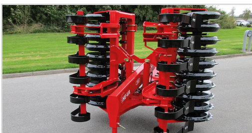
2-sektion 3,00 m Front-Roller med V-Profil, hydraulisk opklap och Spring-Board