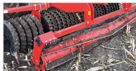
Top-Cutter på Front-Roller