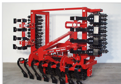
4,00 m Front-Roller m/Cross-kill, hydr. ihopfälln och Spring-Board.