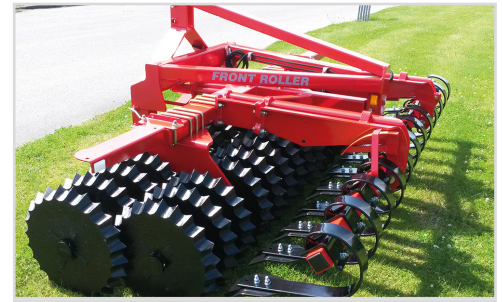
3,00 m Front-Roller Twin m/Ø550/550 mm Stjärnring.