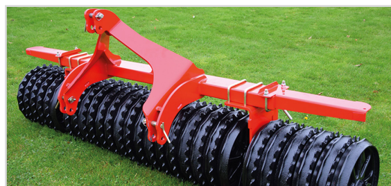
Front-Roller med ett fast trepunktsfäste - inte självstyrande