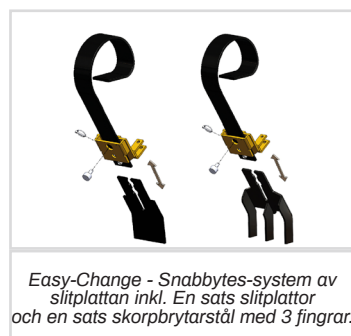
Easy-Change - Snabbytes-system av slitplattan inkl. En sats slitplattor och en sats skorpbrytarstål med 3 fingrar.