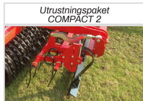
Utrustningspaket COMPACT 2

*Kräver ytterligare 1 st. dubbelverkande oljeuttag