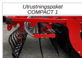
Utrustningspaket COMPACT 1