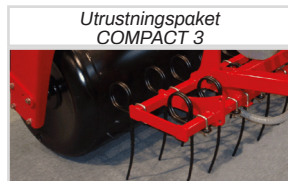
Utrustningspaket COMPACT 3

*Kräver ytterligare 1 st. dubbelverkande oljeuttag