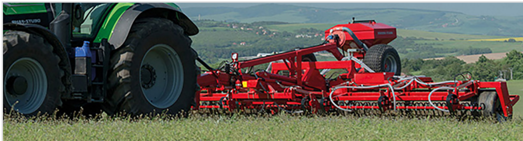
6,30 m Grass-Roller Ø710 mm med udstyrspakke 3 og Multi-Seeder