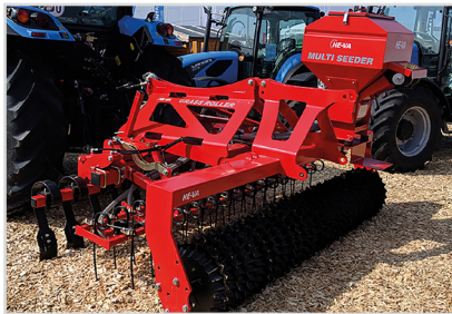
2,90 m liftophængt Grass-Roller med stjernerin-ge og udstyrspakke 4